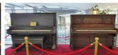
1900년 피아노 사진