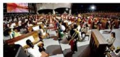
달성 100대 피아노