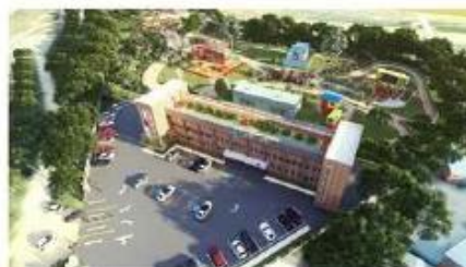
달성문화도시 플랫폼 들락날락