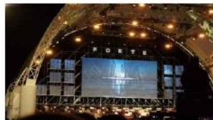
달성 100대 피아노