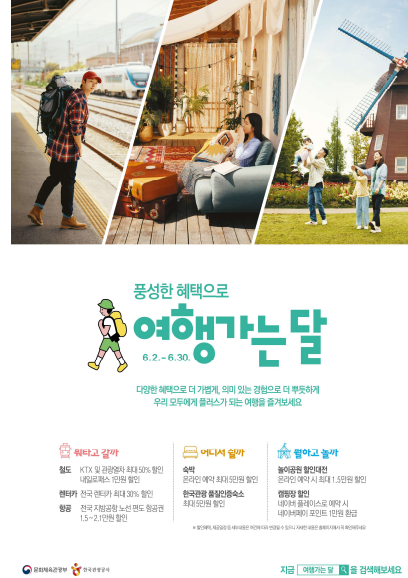
[여행가는 달 홍보 이미지]