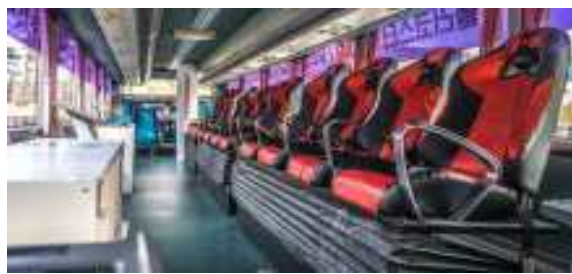
이동형 VR 버스 내부 모습