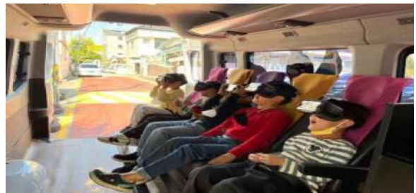
이동형 VR 버스 시연 장면