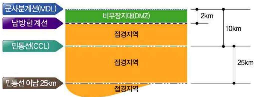
[그림 5-2] DMZ 일원 공간 개념