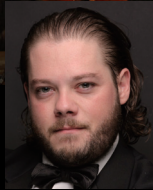
Baritone Fabio Barrutia