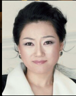
Soprano Young-In LIM