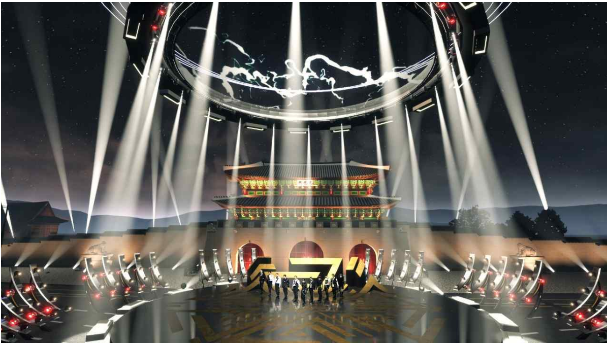
광화풍류 Part2. 온라인 XR 라이브 공연 화면