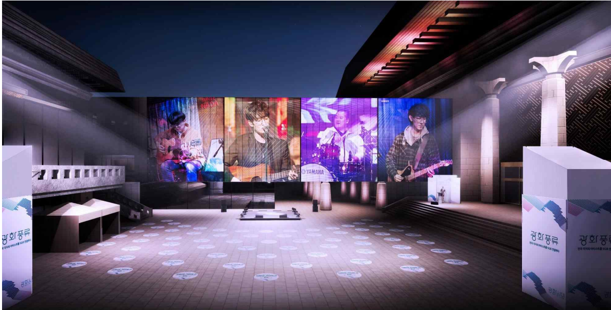
광화풍류 Part1. 5G 실시간 버스킹 공연 무대 디자인