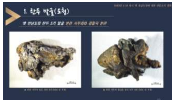
< 탄두 : 옛 전남도청 본관 사무과 벽면 적출 >