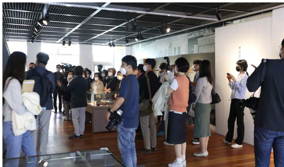
< 특별전 개최 >