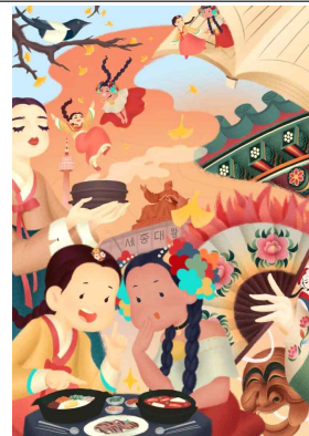
여행(사진, 일러스트, 영상)