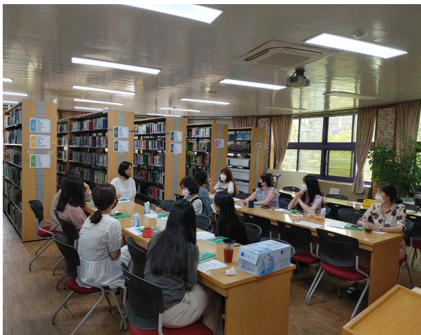
교사 독서토론 (목포제일여자고등학교)