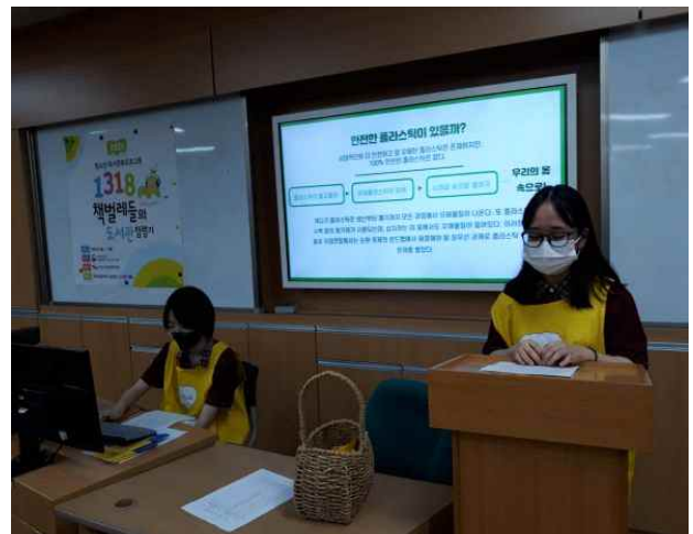
책 읽어주세요 활동(목포제일여자고등학교)