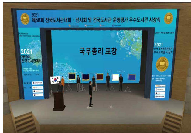
확장 가상세계(메타버스)를 통한 시상식