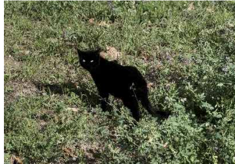
Blondie, 2019