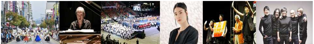
거리행진 1,2부 총 20개 단체 공연