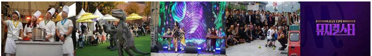
웰컴 로드쇼 프린지 7개 팀 공연