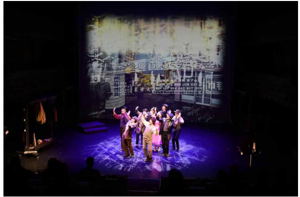
‘2021 K-뮤지컬 국제 마켓’ 시연회 <뮤지컬 선보임>