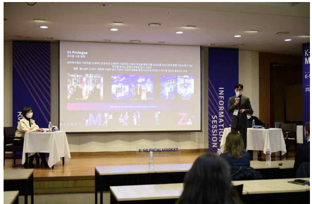
‘2021 K-뮤지컬 국제 마켓’ 투자학술대회