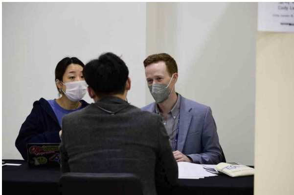
‘2021 K-뮤지컬 국제 마켓’ 일대일 사업상담