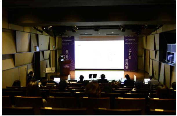
‘2021 K-뮤지컬 국제 마켓 투자’ 제안회 <뮤지컬 드리밍>