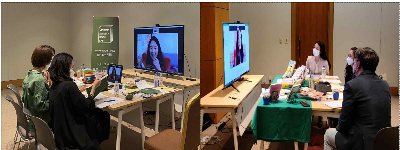
2021년 〈찾아가는 도서전〉 온라인 화상 상담 모습