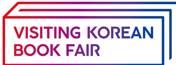
〈찾아가는 도서전〉 상징