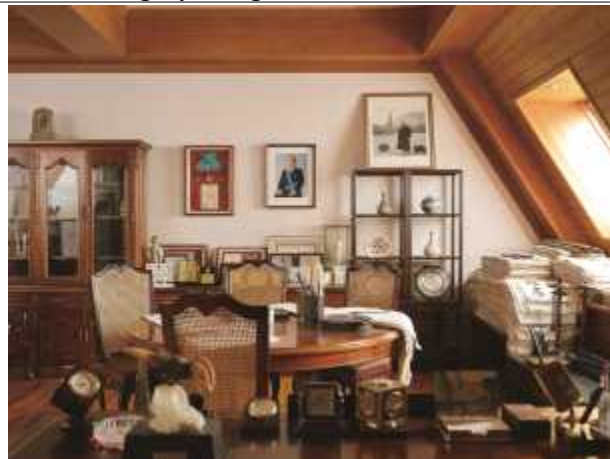
《그 집》