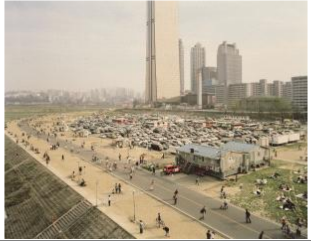
《서울에서 살으렵니다》 박병상 '구조대', 2004