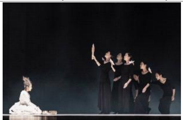
'나인티나인 아트 컴퍼니' 《심연》