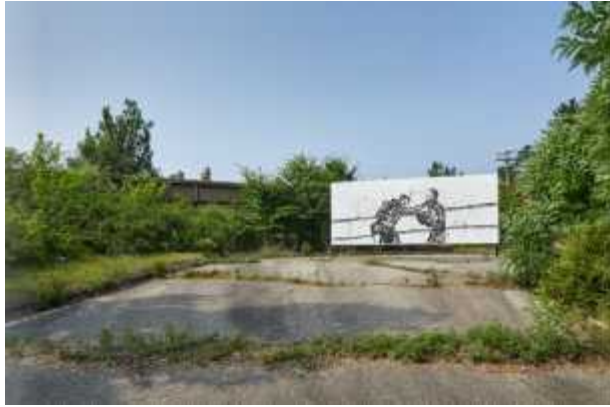
《리얼 디엠지 프로젝트》 최대진, 'ラスト 찬스', 2020, [작가 제공]