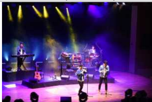
'원초적음악집단 이드'