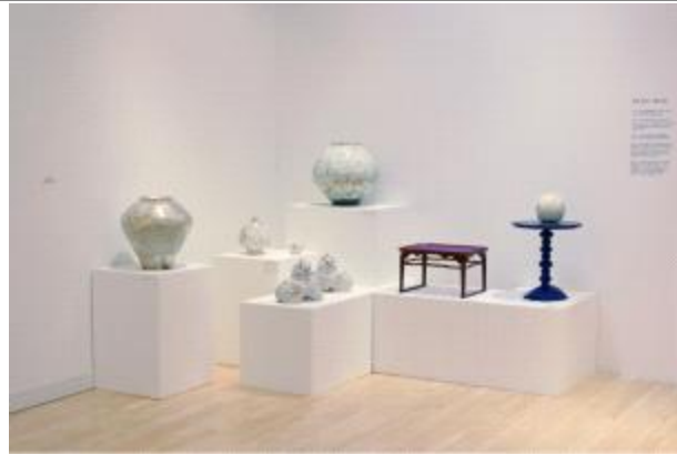
《Living by Design》