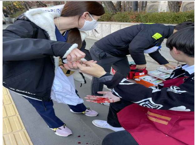
소독 및 지혈