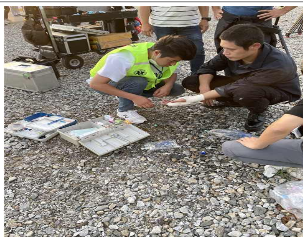
손가락 자상 처치