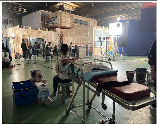
촬영 현장 대기