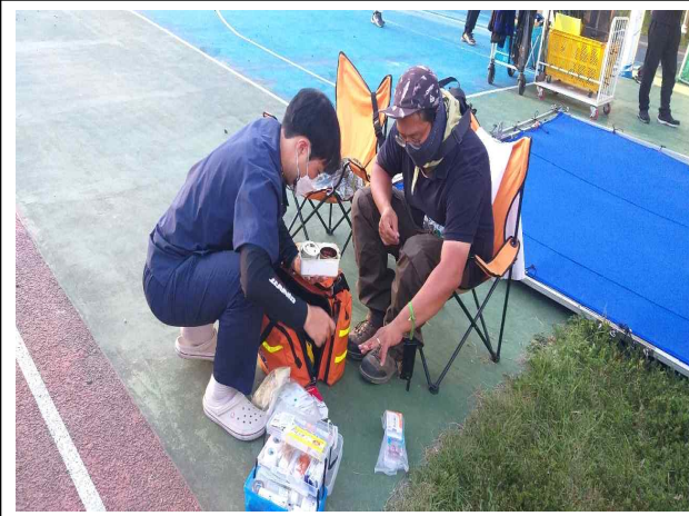
지혈 및 드레싱