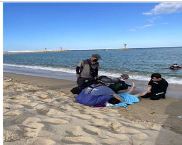
저체온증 응급 처치