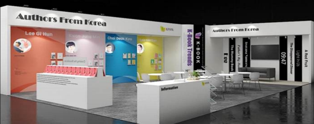
▲ 킬러콘텐츠 전시관(작가홍보관, 작가교류행사) 96㎡(약 29평)