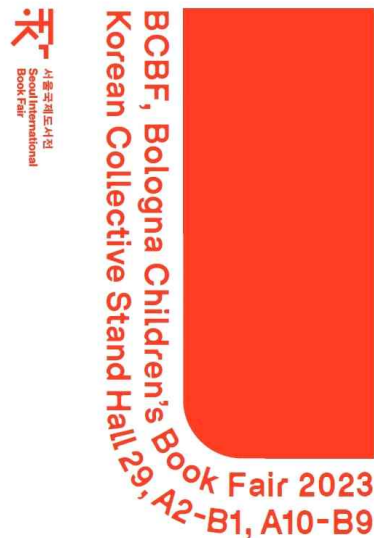
▲ 2023년 블로리아동도서전 한국관 포스터