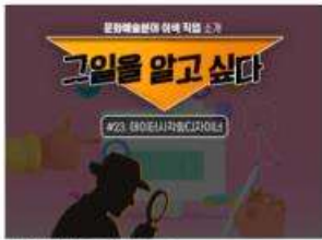
[그일을 알고 싶다] #23. 데이터시각화디자이너