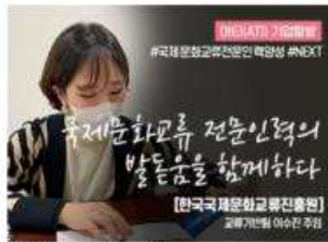
[아티(ATI) 기업탐방] 한국국제문화교류진흥원