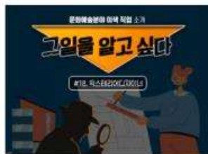
[그일을 알고 싶다] #18. 엑스테리아디자이너