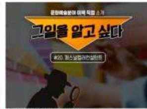
[그일을 알고 싶다] #20. 퍼스널컬러컨설턴트