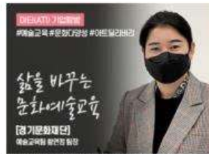
[아티(ATI) 기업탐방] 경기문화재단