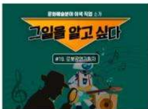
[그일을 알고 싶다] #19. 로봇공연기획자