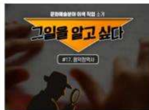
[그일을 알고 싶다] #17. 음악점역사