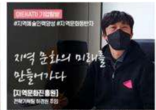
[아티(ATI) 기업탐방] 지역문화진흥원