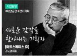
[기업탐방] 아트스페이스 휴