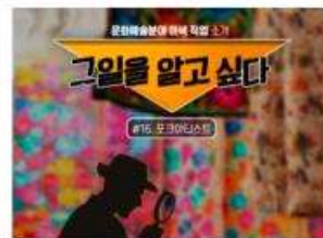
[그일을 알고 싶다] #16. 포크아티스트