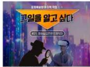
[그일을 알고 싶다] #21. 영화심각콘텐츠제작자