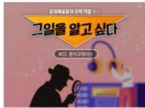
[그일을 알고 싶다] #22. 음악큐레이터