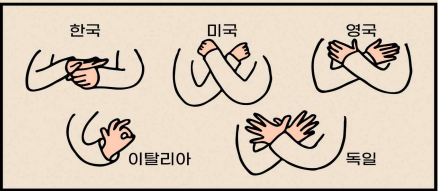
* 각 나라별 ‘사랑해요’를 나타내는 수어

‘한국수어’란? 우리나라 농인이 사용하는 고유한 형식의 수어입니다. 수어도 언어이므로 나라마다 다르답니다. *농인: 수어를 일상어로 사용하는 사람