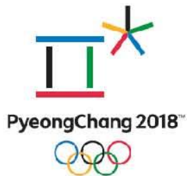
2018 평창 동계올림픽 엠블럼