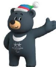
2018 평창 동계패럴림픽 마스코트 반다비