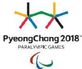
2018 평창 동계패럴림픽 엠블럼