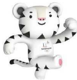
2018 평창 동계올림픽 마스코트 수호랑