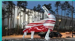
평창올림픽 기념 공공미술작품